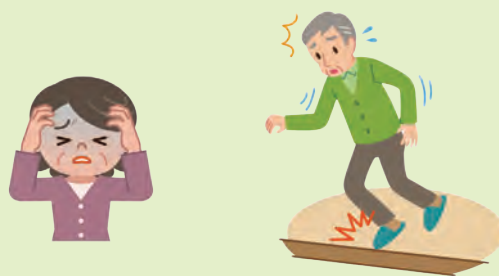
介護に必要と考える費用